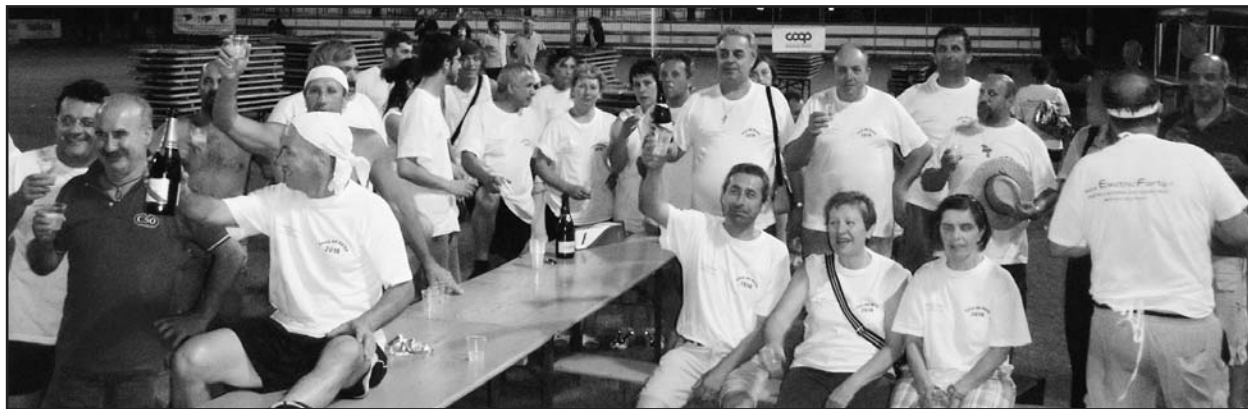
Soddisfazione degli organizzatori al termine della festa.