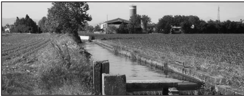
Dopo l'utilizzo sconsiderato degli ultimi anni, ci si augura che il prossimo Piano urbanistico (P.G.T.) di Montichiari tenga in massima considerazione il corretto utilizzo del territorio per un suo sviluppo sostenibile.

Il Piano Governo del territorio, da anni nel solito cassetto della scrivania, è ormai al capoluogo.