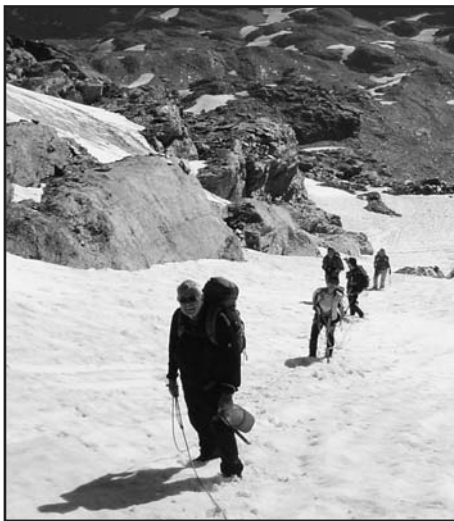
Una significativa immagine del paesaggio.

ha oziato: luglio ed agosto sono stati mesi d'intensa attività.